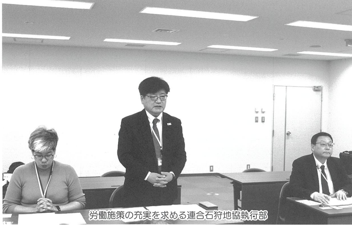
労働施策の充実を求める連合石狩地協執行部