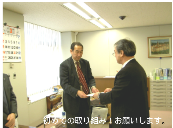
初めての取り組み！お願いします。

3月12日、札幌圏闘争委員会は石狩支庁へ「2008 春季生活闘争 札幌圏道民の生活と雇用の安定に向けた要請書」を提出し、公契約条例の推進による雇用安定、季節労働者に対する雇用と生活安定等について取り組み強化を求めました。石狩支庁への要請行動は今回がはじめての取り組みとなりますが、山本会長は全道の首都である石狩地域において責任ある立場であることを自覚した要請行動であるとし、札幌圏道民の生活と雇用の安心・安全を確保してもらいたいとしました。日野支庁長は、課題により過重なものもあるが、真摯に受け止め報告すべきところはしっかりと報告したいとしました。