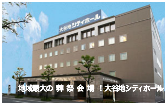
地域最大の葬祭会場！大谷地シティホール

執行部から組合員の皆さんにお願いがあります。今回、会社から配布された「お知らせ」文書と源泉徴収票を破損したり失くしたりせずに大切に保管してください。そして、コピーをとり、組合の役員に早急に渡してください。この2つの資料は会社（ベルコを含む）と皆さんの関係を証明する唯一の資料です。会社から証明書を発行された方もあります。その証明書も保管し、コピーを組合役員に渡してください。今、組合員の職場も忙しく中々会社との協議の時間を確保できません。協議開催までもう少し時間を下さい。