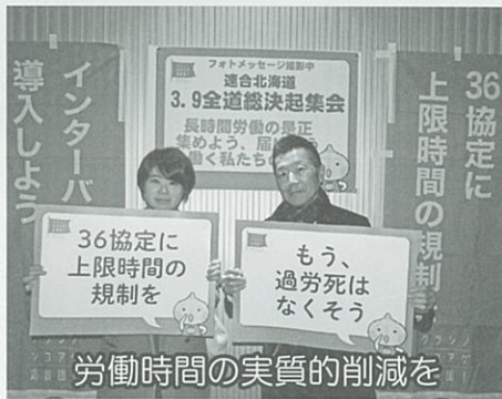
労働時間の実質的削減を

賃金改善を社会全体へ広げよう 2017 春季生活闘争勝利！ 全道総決起集会ひらく (3/9)