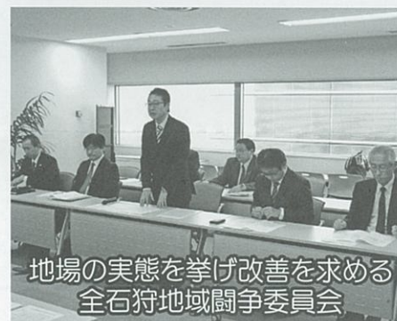
地場の実態を挙げ改善を求める全石狩地域闘争委員会

二〇一七春季生活闘争全石狩地域闘争委員会は労働法制改悪阻止を重点課題としています。特に労働基準法改悪の象徴である労働時間の規制緩和は喫緊の取り組み課題としています。また、長時間労働拡大の口実