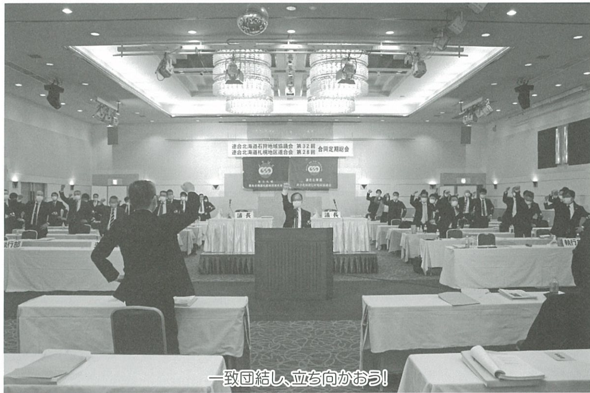
一致団結し、立ち向かおう！

連合石狩地協・札幌地区連合は11月17日に合同定期総会を開催し、2021年度の活動方針を確立しました。