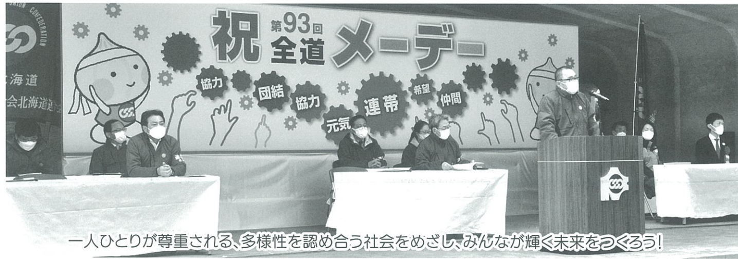
一人ひとりが尊重される、多様性を認め合う社会をめざし、みんなが輝く未来をつくらう！