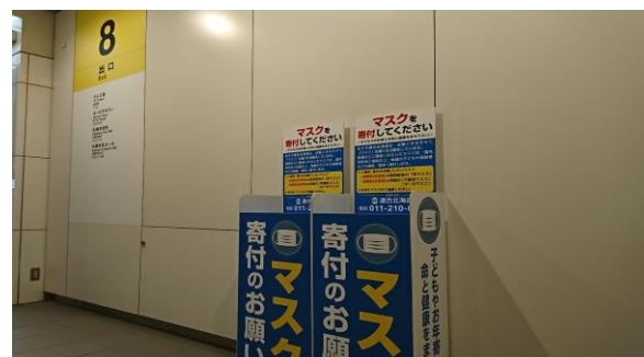
大通駅8番出口表示付近